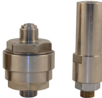
Type AHF 03/04/05